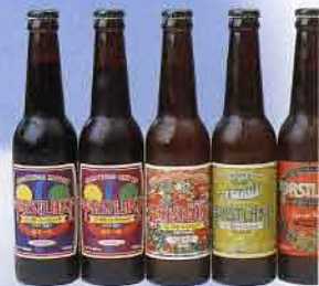
▲しもつま地ビール