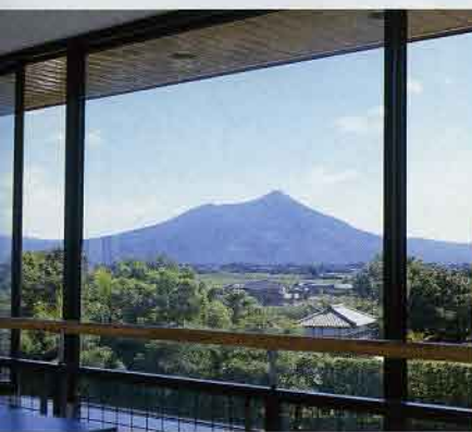
展望室より筑波山を望む

そば打ちめいじん亭では、挽きたてのそば粉を使った名人手打ちのおそばが食べられます。また、そば打ち体験教室を毎月2回（要予約）開催しています。