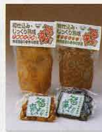
▲特製漬物・手作り味噌