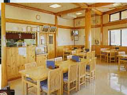
▲そば打ちめいじん亭店内