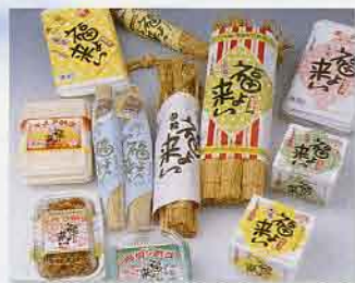
▲しもつま納豆「福よ来い」