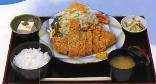
▲ローズポークとんかつ定食

総合案内所では下妻の観光名所や交通、天気などの最新情報を大型ディスプレイで見ることが出来ますので是非ご利用ください。