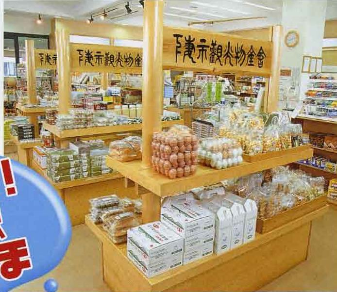
▲物産館土産品コーナー