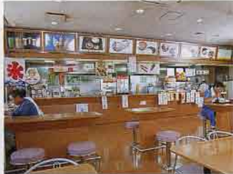
▲ファーストフード