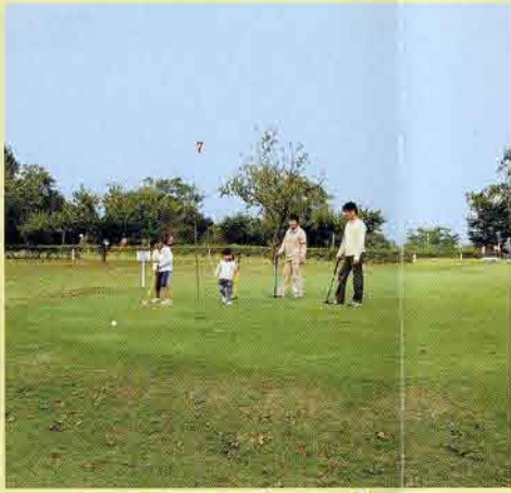
ふれあいパークゴルフ