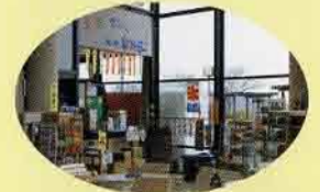
ネイチャーセンター 軽食レストラン