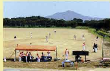
ソフトボール球場・サッカー場